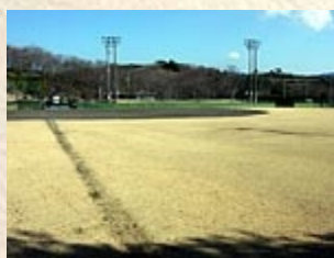
↑さつきが丘球場 (1日目)