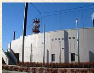
↑沼津市営野球場 (2日目)